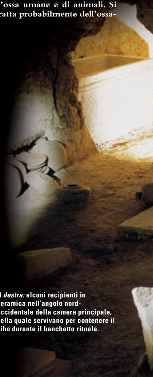
A destra: alcuni recipienti in ceramica nell'angolo nord-occidentale della camera principale, nella quale servivano per contenere il cibo durante il banchetto rituale.