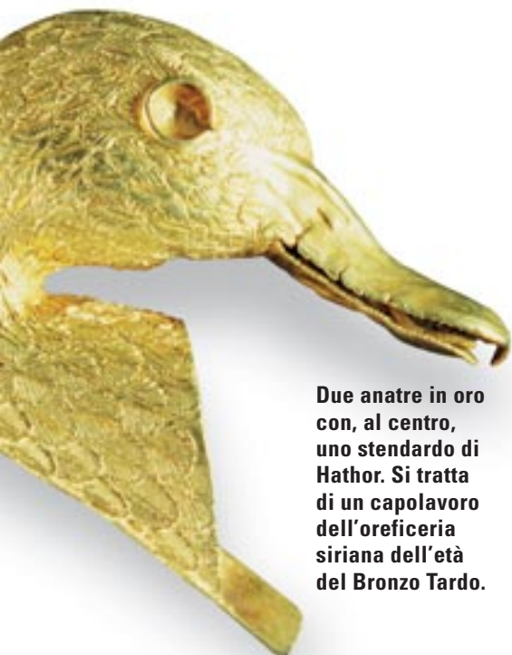
Due anatre in oro con, al centro, uno standardo di Hathor. Si tratta di un capolavoro dell'oreficeria siriana dell'età del Bronzo Tardo.

a.C. ca.; vedi sopra, contributo Morandi Bonacossi). Inoltre, trincee di fondazione nelle parti sud e nord della sala del trono hanno rivelato la presenza omogenea di frammenti ceramici tipici della fine del Bronzo Medio. Grazie a quest'ultima osservazione, il Palazzo Reale di Qatna deve essere datato a una fase storica posteriore al regno di Ashi-Addu e Amud-pi-El. Fra l'altro, tale datazione ben si accorda con il fatto che i due edifici palatini portati alla luce nei Cantieri C e K (vedi i box alle pp. 52 e 53) appartengono alla stessa fase cronologica e si inseriscono nel medesimo progetto di riorganizzazione urbanistica della città dell'età del Bronzo Tardo, di cui lo stesso Palazzo Reale fa parte. La distruzione del palazzo, invece,