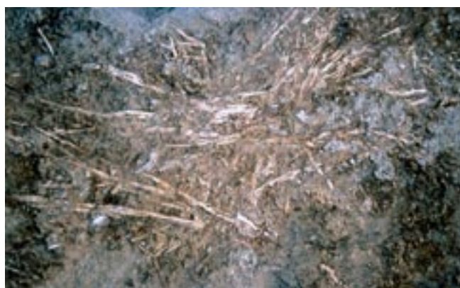
A sinistra: residuo di paglia della spulatura rinvenuto sul fondo della vasca A. Bronzo Antico IV, Cantiere J. In basso: vasche per la spulatura dei cereali collegate a silos utilizzati per immagazzinare il raccolto.

Le ricerche della Missione siro-italo-tedesca hanno cambiato radicalmente lo stato delle conoscenze dell'antica Qatna e così della Siria centrale, soprattutto per quanto riguarda l'età del Bronzo Tardo iniziale (secoli XVI e XV-XIV a.C.), periodo in cui la città visse una delle fasi di massimo splendore urbanistico. In quest'epoca, il suo rango politico non era confrontabile con quello dell'Egitto o del regno nord-siriano di Mitanni; eppure, proprio in questa fase, la dinastia reale qatnita varò un piano di riorganizzazione dell'acropoli. Alla fine del Bronzo Medio II o all'inizio del Bronzo Tardo I, infatti, l'imponente edificio pubblico sulla sommità dell'acropoli fu abbandonato e probabilmente utilizzato come cava per l'estrazione di materiale edilizio (mattoni crudi) da reimpiegare altrove. L'area settentrionale del plateau dell'acropoli venne invece utilizzata per la costruzione del monumentale Pal-